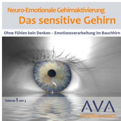
Mit Mudra zur Heilung von Emotionen

Eine CD-Serie, um neue Erkenntnisse und Forschungsergebnisse sowie das Wissen aus Neurowissenschaft und Bewusstseinsforschung auf praktikable Weise anwendbar zu machen. Jede CD ist für sich alleine anwendbar, gemeinsam bilden sie das Fundament für die Gestaltung der eigenen Realität.